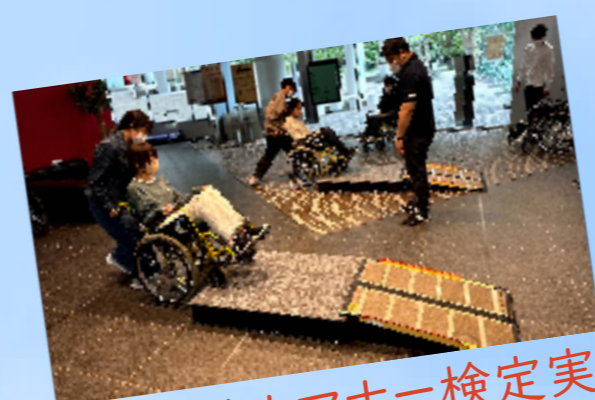
ユニバーサルマナー検定実習