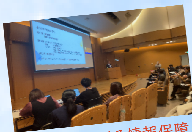
イベントにおける情報保障