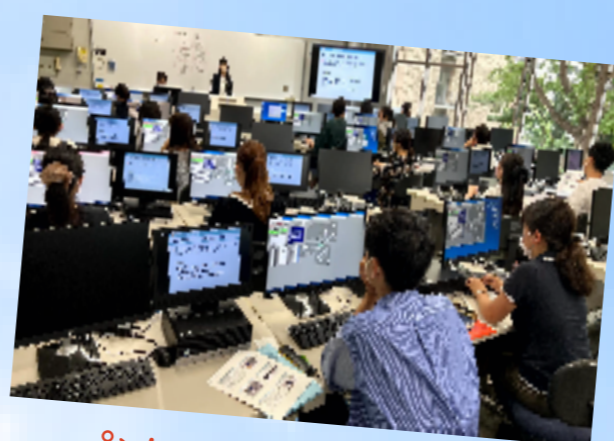
パソコンテイク講習会